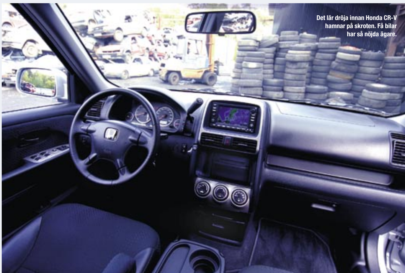
Det lär dröja innan Honda CR-V hamnar på skroten. Få bilar har så nöjda ägare.

H onda CR-V brukar vinna tidningens tester i den lilla SUV-ligan.