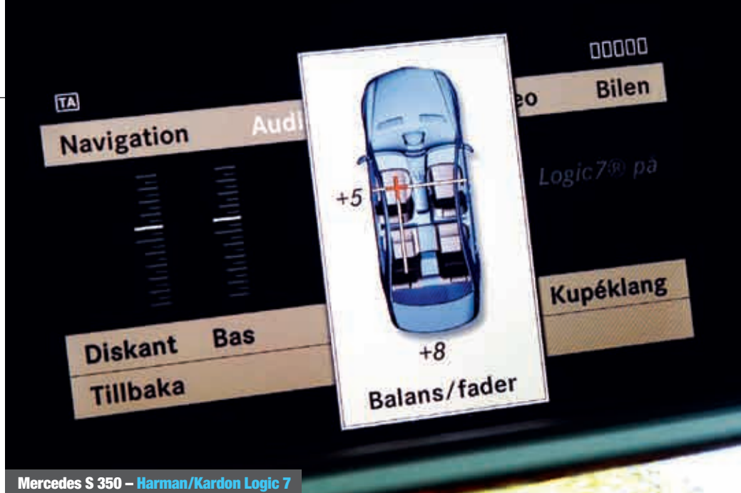
Mercedes S 350 – Harman/Kardon Logic 7

Totalintryck: Mercedes H/K-anläggning ger gott om djupbas och ljudbilden upplevs som bra även i baksätet. Men klangen är lite hård och basen saknar fylligheten och spänsten hos Audi och Lexus.