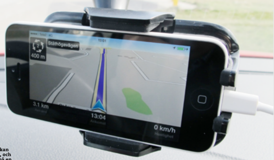
Med en bra bilhållare kan du navigera i mobilen, och du slipper släpa runt på en extra navigator.

Nu har navigationsapparna blivit riktigt bra, och många kan ersätta en "riktig" navigator. Här testar vi åtta appar – från gratis till svindyr.