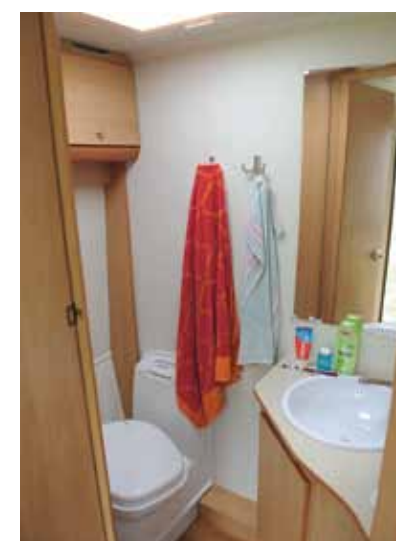
Skåpet på bilden saknar lås. Bör därför tömmas före avfärd.

Hygien och det sanitära är viktiga punkter men ingen av dessa resevagnar samlar på sig några pluspoäng i tvättutrymmet, i stället lämnar de ett par frågetecken. Exempelvis har Solifer ett tvättställe som sitter extremt högt upp (94 centimeter), eller rättare sagt hade. För efter ett samtal med fabriken i Dorotea har Solifer bestämt sig för att sänka tvättstället 10 centimeter – en höjd som konkurrenten Eximo redan har sitt tvättställe på.