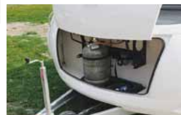
Utrymmet i Solifer är snarlikt men öppningen lite mindre.