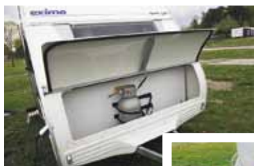
Eximo har en gasolkoffert från Kabe. Bra öppning men hög lasttröskel

Ingen har lastlucka, ingen har heller belysning i gasolkofferten. Bägge har hög lasttröskel, Solifer har i detta utförande försvinnande liten lastförmåga, 25 kilo. Eximo har 50 kilos lastförmåga, också det mycket lågt.