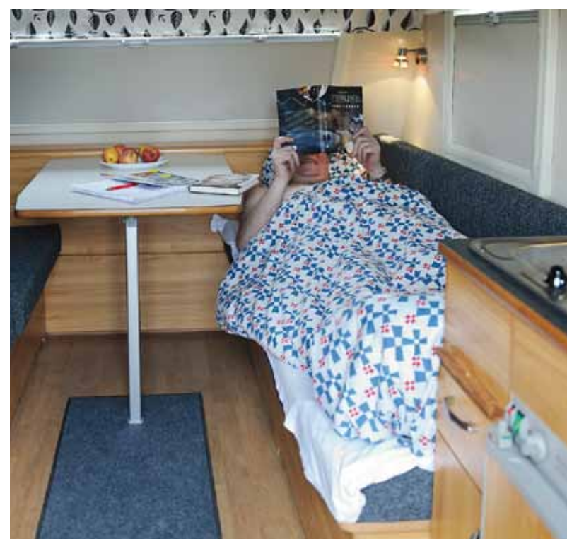
Sängen breddas enkelt genom att man skjuter in ryggstödet helt. Än mer plats skulle man få om ryggdynan gick att ta bort helt eller vinklas upp mot väggen.