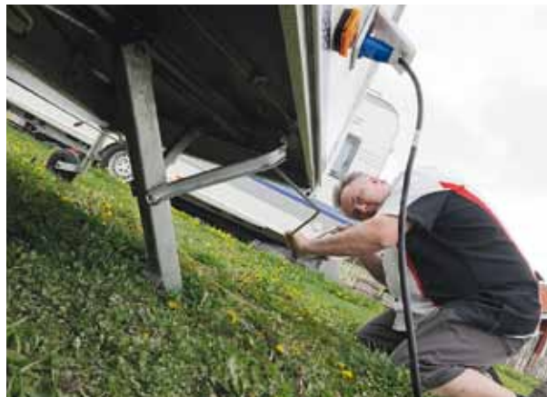
Luttrade testare konstaterar att här måste man ner på knä för att hitta skruvarna.

Två lättfunna stödben, kan det bli enklare? Den längsta vagnen Eximo är bara 557 centimeter från koppling till baklyse, Solifer 501 centimeter. Lätthanterligt så det förslår.