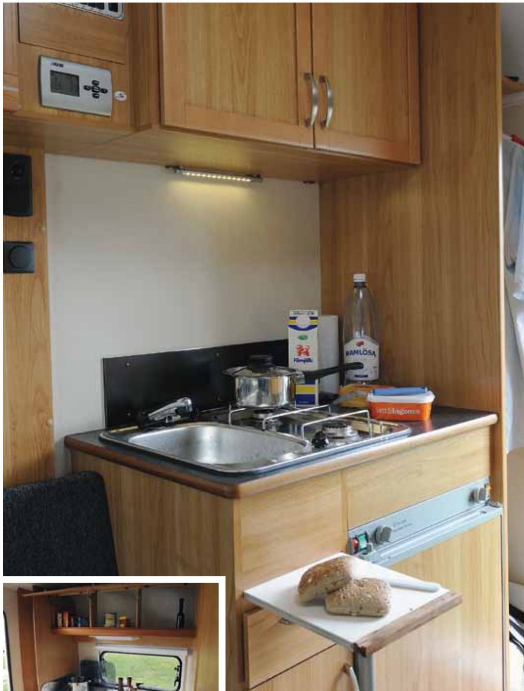
Köket i Solifer är litet och anpassat, duger åt smalmat.

Båda vagnarna har 2-lågiga spisar men det är bara Eximo som har ett fönster som ger arbetsytan extra ljus. Men det faller ändå inget mörker över Solifer som har en diodbelysning att tillgå. Den fungerar nämligen mer än väl.