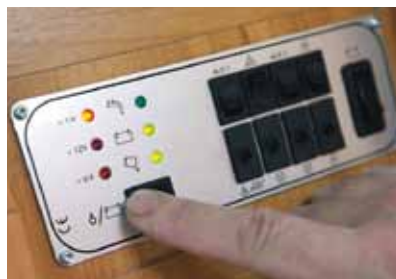
Manöverpanel i Solifer med en knapp för varningsblink känns lyxig.

Här hämtar Solifer hem lite gratispoäng i det att den har vattenburen