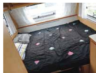
Eximo färdig för natten.

Vila på rygg och sova är skönt – och det gör man allra bäst i Eximo. Men vi vill tillägga ett men, för om man väljer att inte omvandla de båda sofforna till en dubbelsäng då blir det svårt att sträcka ut, då sofforna bara mäter 184 centimeter.